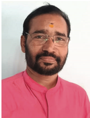
സേതു തിരുവെങ്കിടം സെക്രട്ടറി